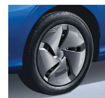
Essential 15" oceleové disky + pneumatiky 185/65R15