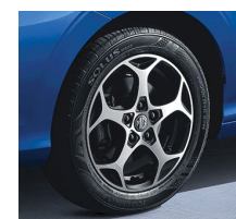
Emotion 16" zliatinové disky + pneumatiky 195/65R16

*Metalické a trojvrstvé farby sú za príplatok vo výške 600 EUR s DPH